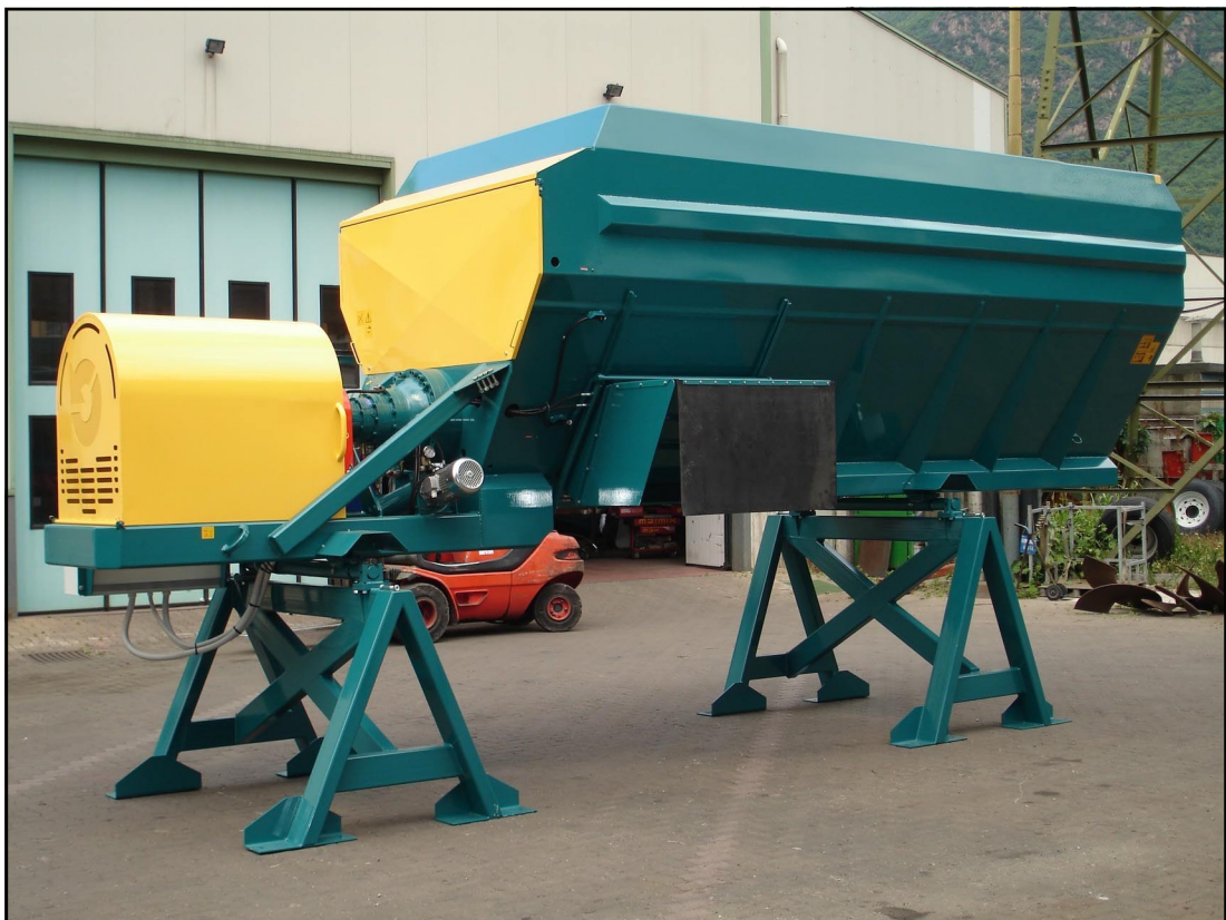
Vue d'ensemble du modèle à poste fixe avec commande par moteur électrique